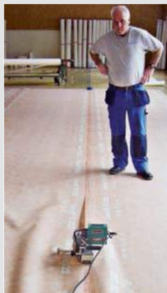
COMET SUB-ROOF Ideální pro prefabrikaci.