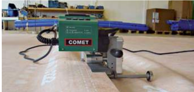
Automatické vedení a posuv.

Přístroj určený pro prefabrikaci podstřešních membrán.